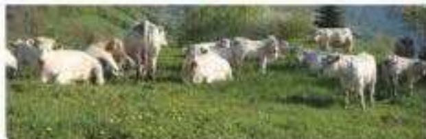
Herd Book Charolais - Agropôle du Marault - 58470 Magny-Cours - France

Int. de prélevement: HBCA105000240833154 Gène Sans Corne: PoPo - Homozygote BVD: Non détecté Gène MH (isolant): Non porteur